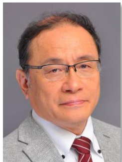
東京科学大学 物質理工学院特定教授 早稲田大学研究戦略センター教授