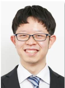
PWB/デバイス信頼性評価事業部 マネージャー パワーデバイス評価 プロフェッショナル